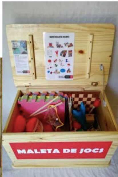
La maleta de jocs de la Plaça Navas Districte de Sants-Montjuïc