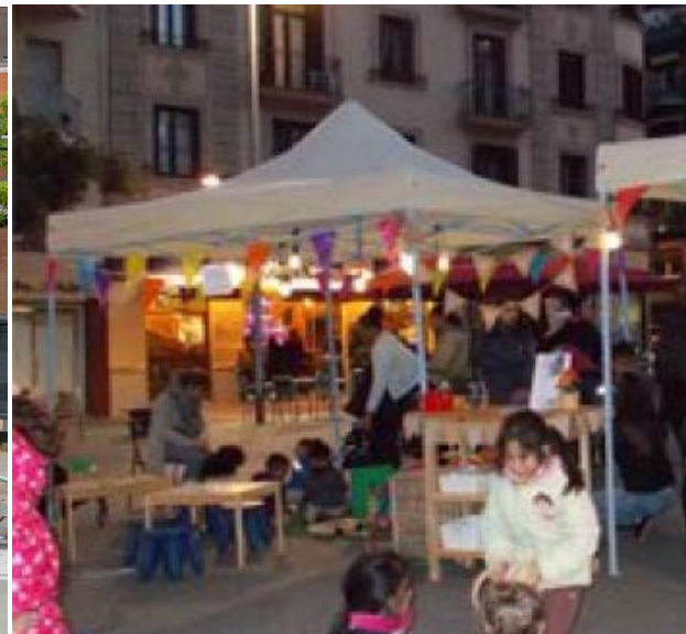
Racó de jocs (Poble-Sec). Districte de Sants-Montjuic