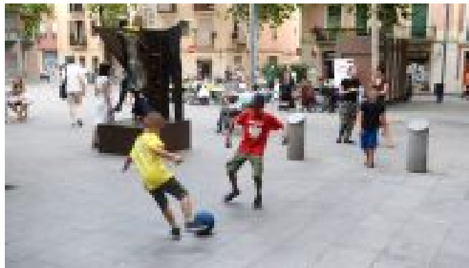
Intercanvi de pilotes d'escuma Districte de Gràcia