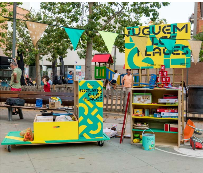
Quiosc de joc. Districte de Sant Andreu