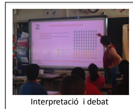
Interpretació i debat