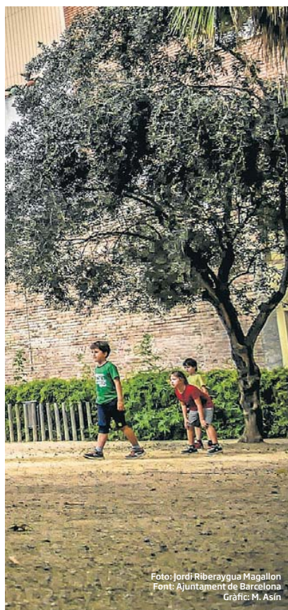
Foto: Jordi Riberaygua Magallon Font: Ajuntament de Barcelona Gràfic: M. Asin

fets amb la seva vida, però el 31% restant diuen que no n'estan prou. I, d'aquests, un 8% diuen que estan poc o gens satisfets amb la vida. Els responsables de l'enquesta asseguren que s'ha de tenir en compte el "biaix de l'optimisme vital", és a dir, el fenomen segons el qual els infants tendeixen a respondre més positivament que els adults a les mateixes preguntes. Però els resultats no són homogenis per al conjunt de la ciutat.